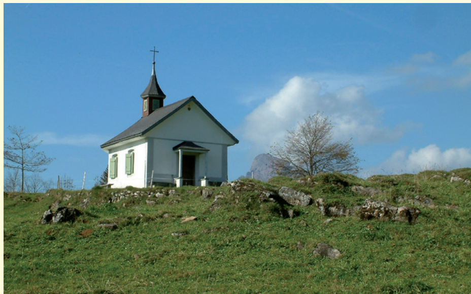
Herz Jesu Kapelle, Hinterer Oberberg

Mit der Seilbahn Illgau- St. Karl, die mitten im Dorf ist, gelangen Sie an den Ausgangspunkt, der Bergstation Oberberg-St.Karl. Nach kurzer Laufzeit erreicht man das heimelige Bergrestaurant Oberberg. Von hier geht's 100m entlang der Strasse bis zum Alpbäude. Jetzt steigt der Weg kurz steil an zum malerischen Baumkragen. Vorbei bei der Alp unt. Chaltenbrunnen folgen wir dem Wanderweg Richtung Strit – Hinter Oberberg. Wir durchqueren die Rieter mit ihren Magerwiesen, Blumen und fast ein Dutzend «Euschen». Diese wurden bis ins letzte Viertel des 20.Jhdts. für die Zwischenlagerung des Bergheu's benützt, welches erst im Winter mit Schlitten, den «Männeln» zu den Winterstallungen des Viehs geführt wurde. Leicht steigend geht es durch «Busch und Wald» zum Zopf, Punkt 1330. Hier lädt beim Wegweiser ein Bänklein zu einer kurzen Rast ein. Der Kaiserstock mit seinen Vasallen, der Fronalpstock und