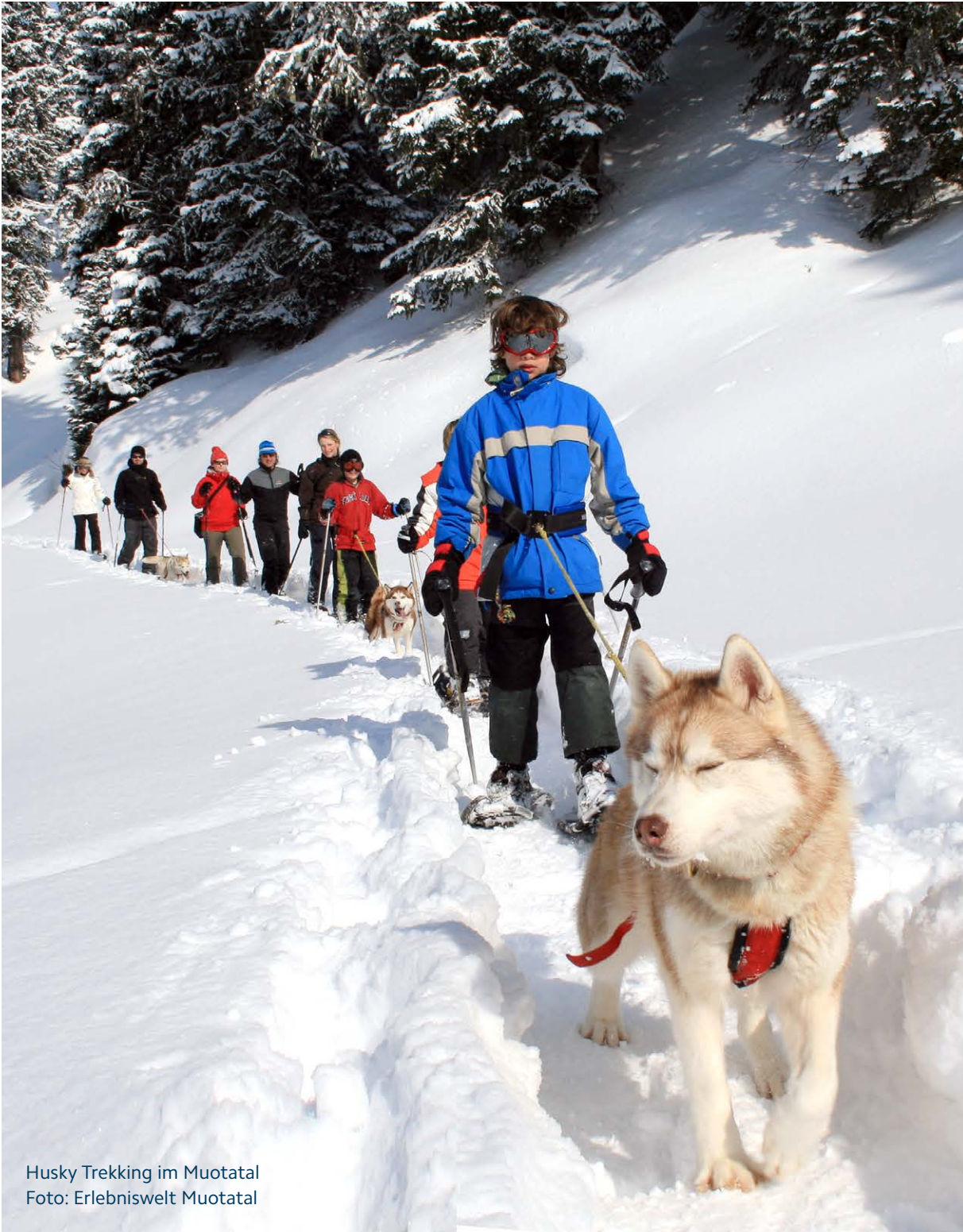
Husky Trekking im Muotatal